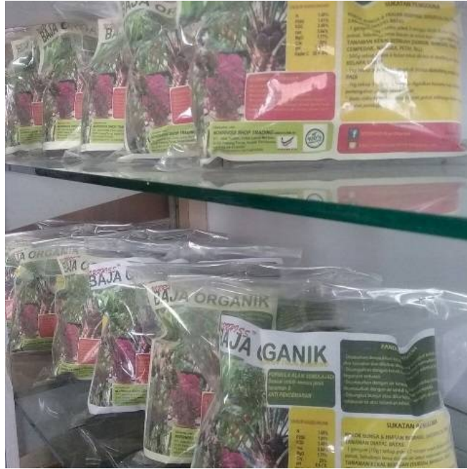
Caption : Baja Organik