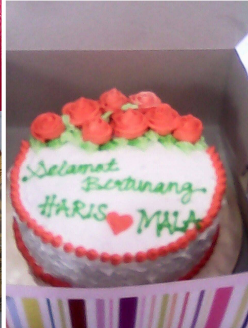
Antara kek yang dihasilkan Puan Mazlina